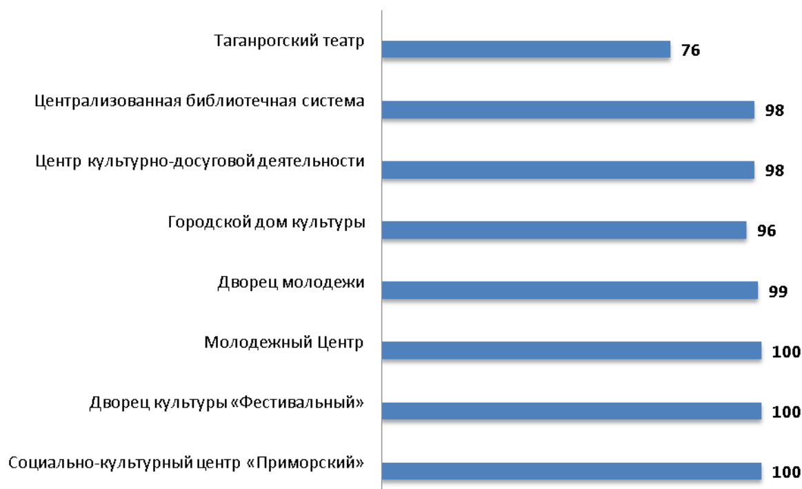
Рисунок 4.1 – Интегральные показатели, характеризующие комфортность условий предоставления услуг в организациях культуры г. Таганрога Ростовской области, баллы

Анализ интегральных показателей в организациях культуры г. Таганрога Ростовской области показывает, что в отношении комфортности условий предоставления услуг зафиксированные оценки параметров находятся на высоком уровне: