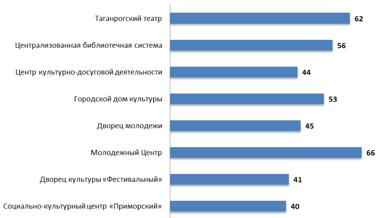
Рисунок 5.1 – Интегральные показатели, характеризующие доступность услуг для инвалидов в организациях культуры г. Таганрога Ростовской области, баллы

Анализ интегральных показателей исследуемых организаций культуры г. Таганрога Ростовской области показывает, что в отношении доступности услуг для инвалидов зафиксированные оценки параметров демонстрируют значительный разброс: