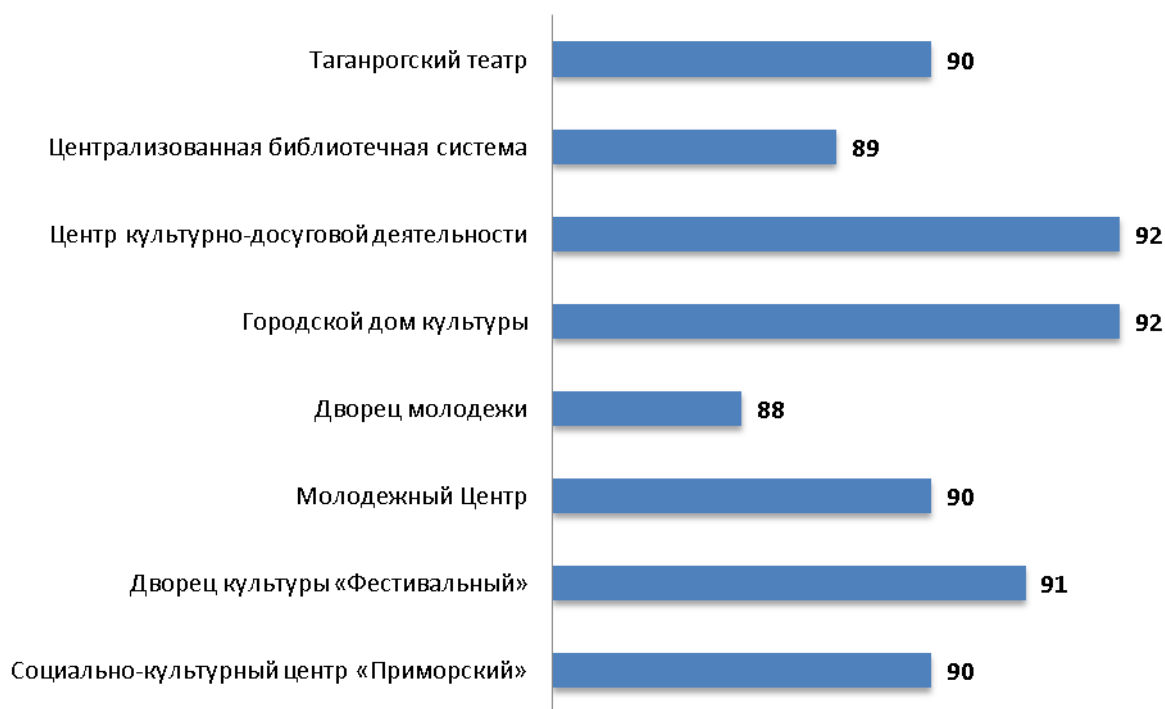
Рисунок 3.1 – Интегральные показатели, характеризующие открытость и доступность информации об организациях культуры г. Таганрога Ростовской области, баллы

Анализ интегральных показателей организаций культуры г. Таганрога Ростовской области показывает, что в отношении открытости и доступности информации зафиксированные оценки параметров находятся на достаточно высоком уровне: